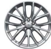
21" MIT 5 DREIFACHSPEICHEN SATIN POLISHED (STYLE 5091)