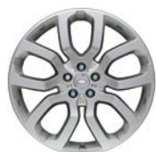
22" MIT 5 DOPPELSPEICHEN (STYLE 5004)