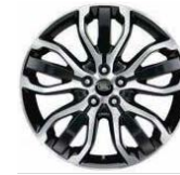
21" MIT 5 DREIFACHSPEICHEN GLOSS BLACK, DIAMOND TURNED (STYLE 5007)