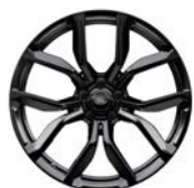
22" MIT 5 DOPPELSPEICHEN IN GLÄNZEND SCHWARZ (STYLE 5083)