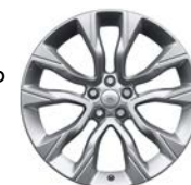
22" MIT 5 DOPPELSPEICHEN (STYLE 5086)