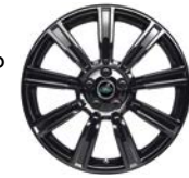
21" MIT 9 SPEICHEN GLOSS BLACK (STYLE 9001)