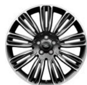
22" MIT 9 DOPPELSPEICHEN IN DARK GREY, DIAMOND TURNED (STYLE 9012)