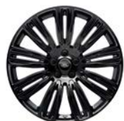
22" MIT 9 DOPPELSPEICHEN IN GLÄNZEND SCHWARZ (STYLE 9012)