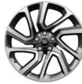
21" MIT 5 DOPPELSPEICHEN DIAMOND TURNED (STYLE 5085)