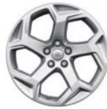
20" MIT 5 DOPPELSPEICHEN (STYLE 5084)