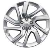
21" MIT 5 DOPPELSPEICHEN (STYLE 5085)