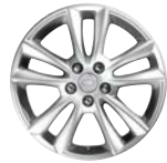
19" MIT 5 DOPPELSPEICHEN (STYLE 5001)