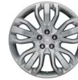
21" MIT 5 DREIFACHSPEICHEN (STYLE 5007)