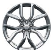
22" MIT 5 DOPPELSPEICHEN SATIN POLISHED (STYLE 5083)